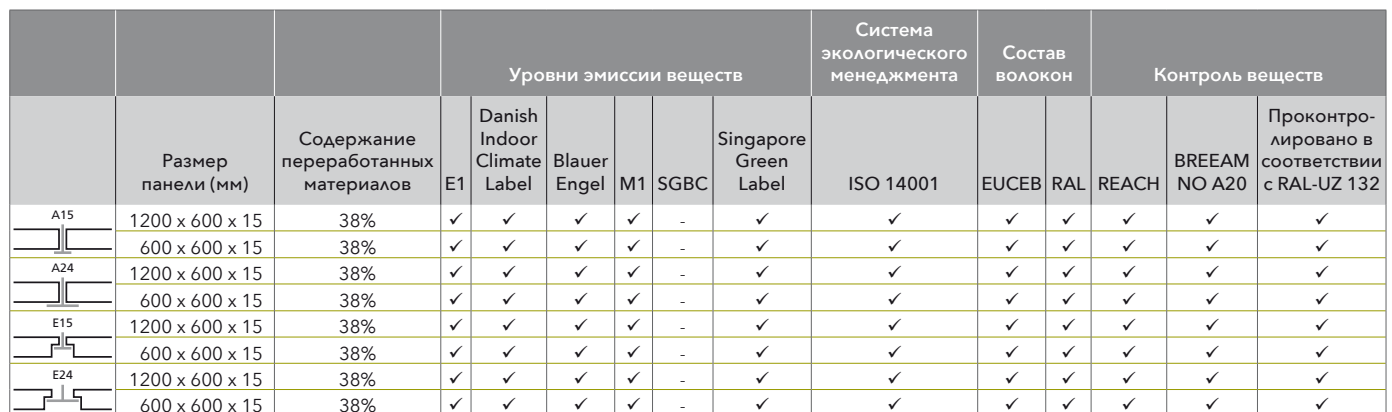
Таблица компонентов, входящих в состав материала

Следующая таблица подразделяет продукцию на категории по типу кромки и содержит всю необходимую информацию по экологическому профилю.